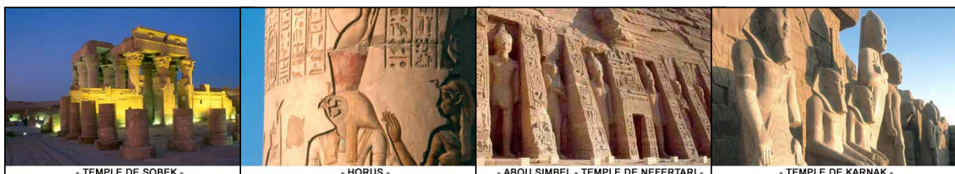
- TEMPLE DE SOBEK -

Programme type, susceptible de modification en fonction des horaires de vols et pouvant être inversé.