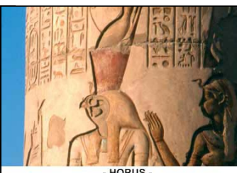
- HORUS -