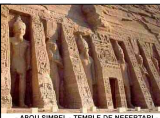
- ABOU SIMBEL - TEMPLE DE NEFERTARI -