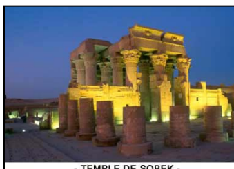
- TEMPLE DE SOBEK -

Estimations tarifaires sous réserves de modifications ultérieures et à reconfirmer auprès de notre service lors de votre positionnement d'option et de votre confirmation.